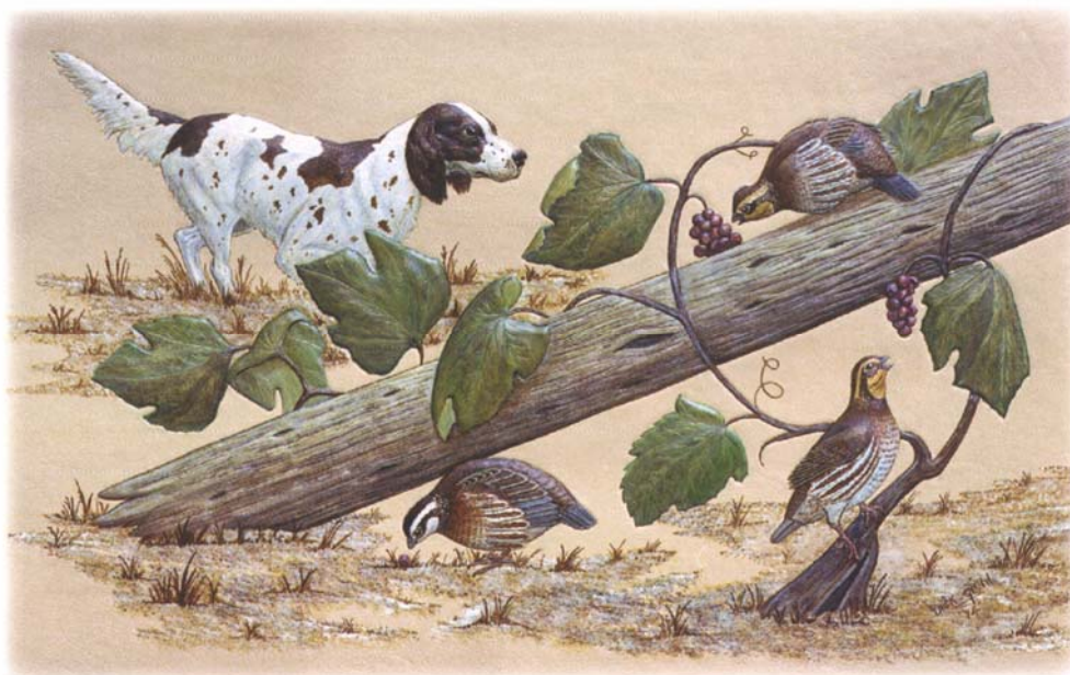
Собаки известны верностью своим хозяевам