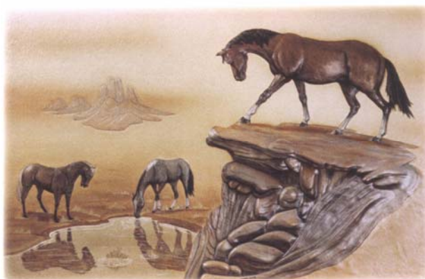
Обученный конь подчиняет свою силу и энергию своему хозяину